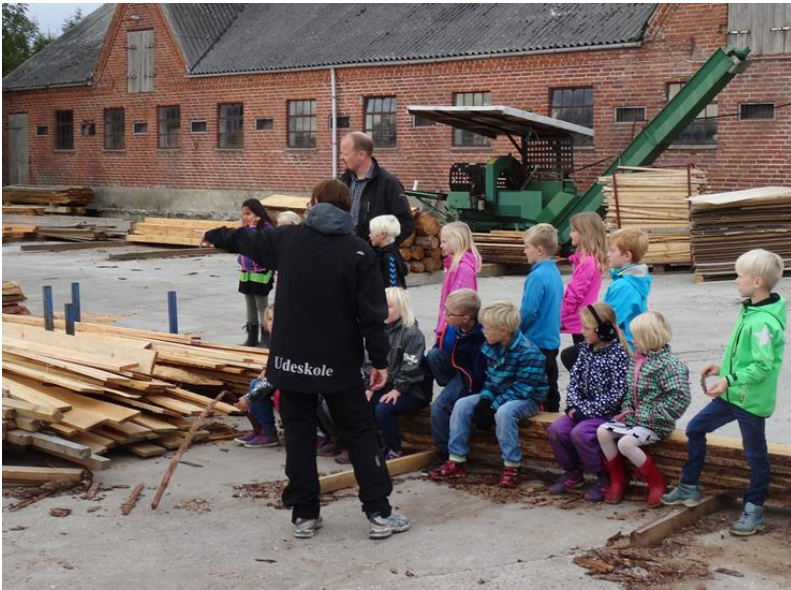
Figur 3. En lærer med udeskole-arbejdstøj på et savværk med 1. klasse.

Når en lærer og en klasse skal udenfor skolens matrikel, vil det ofte være nødvendigt at bemane turen med en ekstra lærer eller pædagog, der kender klassen. I de yngste klasser deltager pædagoger i en del af skolearbejdet, og fx inklusionslærere eller andre fagpersoner, der er tilknyttet en klasse, kan med fordel også deltage.