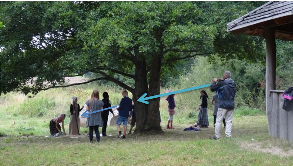
Figur 11. Drengen i korte bukser og blå trøje filmer et sagn, klassen arbejder med på klassens tablets. Læreren filmer hele sammenhængen for at bearbejde elevernes arbejde på en mobiltelefon. Elevernes film bliver en fortolkning af livet i middelalderen, men lærerens bliver til respons til eleverne på deres arbejdsformer og samarbejde.

De fleste værktøjer under de hidtidige typer rummer et læringselement. Men læringsaktiviteter kan også fremhæves som en selvstændig type apps. Et særligt aspekt i forhold til læring i forbindelse med udeskole er muligheden for, at udbyder og bruger smelter sammen (se figur 1e). Teknologien giver muligheder for, at elever kan lære gennem formidling af viden om omgivelserne eller aktiviteter i omgivelserne til andre. Når eleverne formidler viden, kan lærerne se, hvordan eleverne har opfattet en given problemstilling, og dermed give feedback til eleverne. Formidling gennem præsentationer kan være gavnlig som formativ evaluering. Uddannelsesforskning viser, at feedback og formativ evaluering betyder meget for elevernes læring (Hattie 2009).